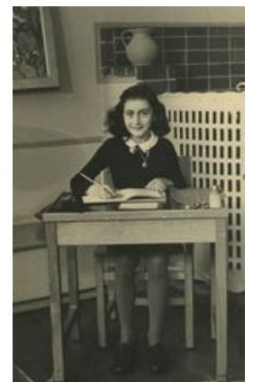
Anne Frank en 1940

C'est un très beau livre sur la persécution des juifs, pendant la seconde guerre mondiale. Nous le conseillons pour des lecteurs qui ont le cœur bien accroché !