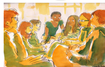
Aquarelle de C. Cabanis

Les élèves y parlent de leurs lectures et sont allés en septembre assister à une séance de dédicace de Riad Sattouf à la librairie Vivement Dimanche.